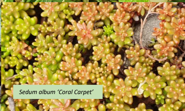
Sedum album 'Coral Carpet'

Juli 2020. Toen de Botanische Tuin begin juni zijn deuren opende, waren veel bezoekers heel blij dat ze na lange tijd weer in de tuin konden rondlopen. Nu is de zomer begonnen en omdat de meesten van ons nog niet zeker weten hoe onze vakantieplannen eruit gaan zien, brengen we alvast een klein stukje uit de bergen naar u toe.