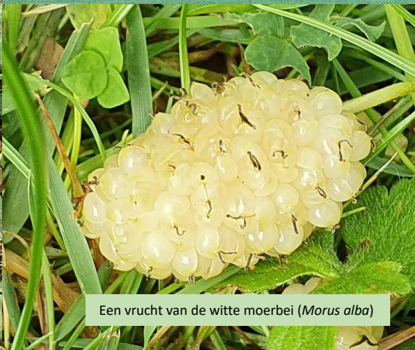
Een vrucht van de witte moerbeï ( Morus alba )