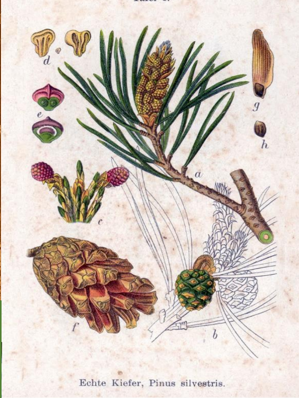
Echte Kiefer, Pinus sylvestris.

Het is nu nog onzeker wanneer de Botanische Tuin haar poorten weer mag openen. Checkt u voorafgaand aan een mogelijk bezoek even onze website of de facebook/Instagrampagina? Daar vindt u alle up-to-date informatie.